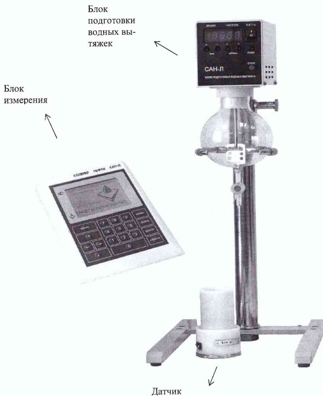
Рисунок 1 – Общий вид солемера САН-Л

Уровень защиты ПО соответствует уровню С по МИ 3286-2010.